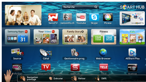
Le SMART HUB de Samsung

L'offre du catalogue complet de programmes Video On Demand (VOD) – déjà disponible sur le traditionnel boîtier SwissTV et sur la plateforme VOD de Naxoo – permet à l'utilisateur de regarder les programmes de son choix à tout moment depuis le confort de son « home sweet home ».